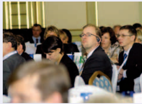
Дискуссия с Д. Киселевым

Большой интерес вызвали вопросы обеспечения лекарственными препаратами. Представители различных диабетических ассоциаций обратились с требованием адекватного обеспечения инсулином, сахароснижающими препара-