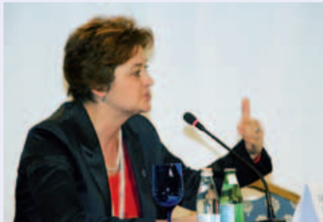
Директор института Диабета, ФГУЭНЦ М.В. Шестакова

В ходе дискуссии обсуждалось, что такое диабет, что способствует развитию диабета, какие пищевые продукты следует ограничивать, важность физических нагрузок и занятий спортом.