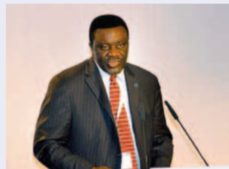
Жан Клод Мбанья

По словам Аннана, не исключено, что заболеваемость в России превышает все мировые показатели, ведь статистика в стране неточна. Кроме того, диагностика сахарного диабета 2 типа в России одна из самых низких в мире: 75% людей с диабетом (а это более 6 млн человек) не подозревают о наличии у них болезни. Уровень заболеваемости в России вплотную подошел к эпидемическому порогу, и, по мнению врачей, угрожает национальной безопасности страны.