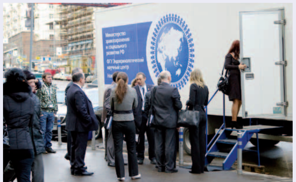
Передвижной диабетический центр