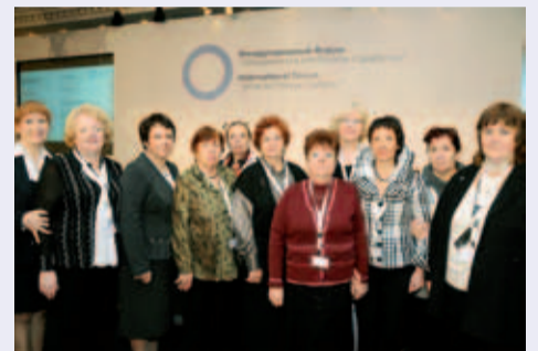
Представители ОООИ РДА